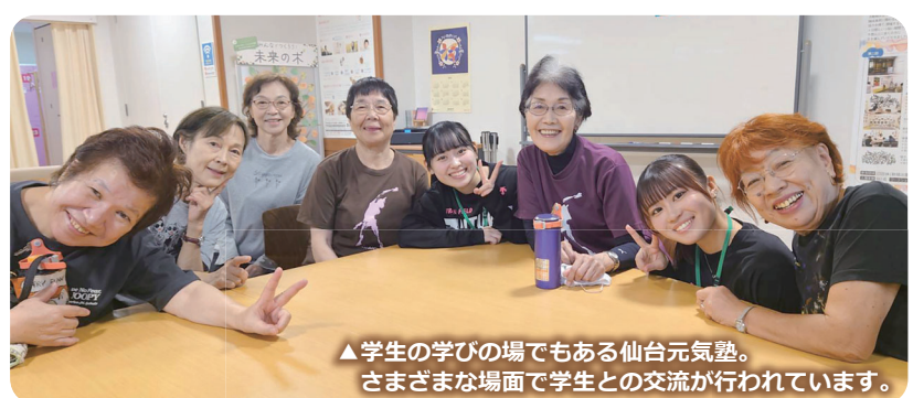
▲学生の学びの場でもある仙台元気塾。さまざまな場面で学生との交流が行われています。