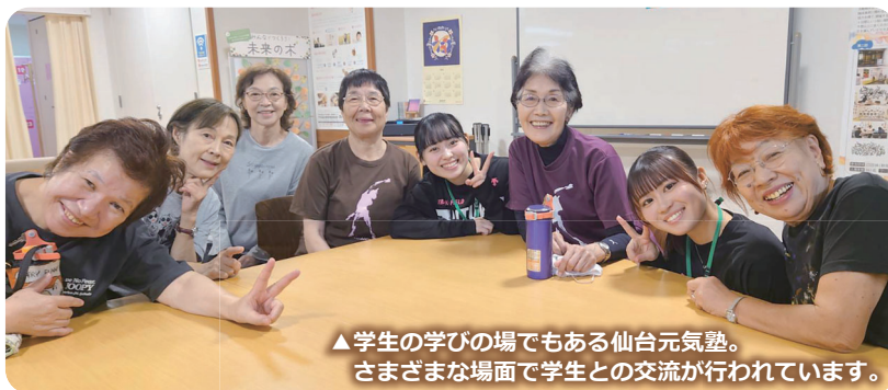
▲学生の学びの場でもある仙台元気塾。さまざまな場面で学生との交流が行われています。